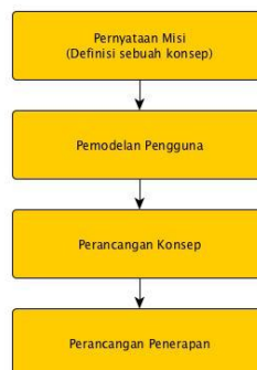
Gambar 1 Fase-fase dalam WSDM, disadur dari (Plessers, Casteleyn, & Troyer, 2005)

Dengan perkembangan Semantic Web yang semakin dibutuhkan, metodologi WSDM dikembangkan untuk dapat membantu perancangan dan pengembangan web dengan menambahkan arsitektur Semantic Web di dalamnya. Gambar 1 menjelaskan secara garis besar tentang metodologi WSDM secara umum dan bagaimana pada setiap fase kemudian dikaitkan dengan pengembangan semantic webnya.